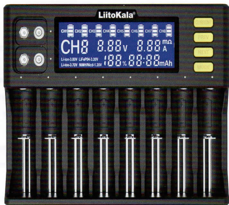
Зарядное устройство Lii-S8. Руководство пользователя.